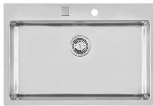
Fregadero KE Filotop 2266 050